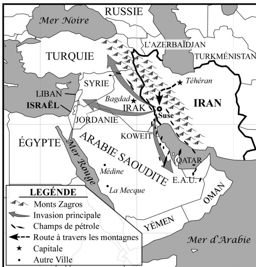
Carte du Moyen-Orient montrant l'Iran, avec la zone de départ autour de Suse, et les trois directions de l'invasion.

praticables ; les routes à travers les monts sont peu nombreuses. Si les forces iraniennes envisageaient de traverser les monts Zagros, cela impliquerait pour les chars, les véhicules et les autres forces mobiles de rouler en file indienne » expliqua Mike.