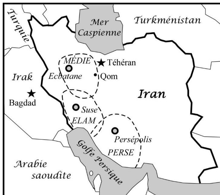
Carte de l'Iran actuel et des anciennes terres ancestrales sur son territoire.